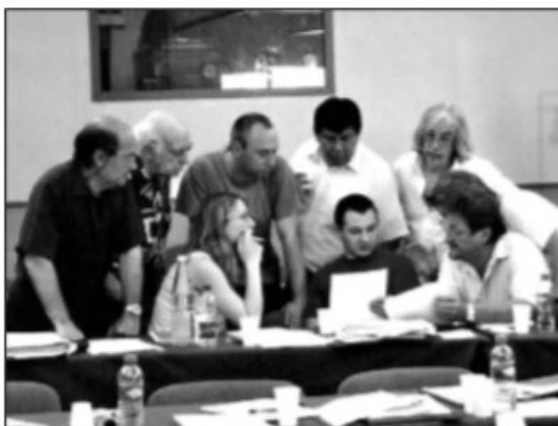
Juin 2006. Délégation du syndicat CGT CETE de Normandie et du Centre, au 6 e congrès de l'USSERE 4 .