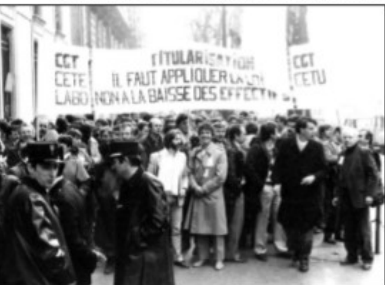
Le 6 mars 1985, devant le ministère de l'équipement

Robert a une qualité dont beaucoup devraient s'inspirer, c'est un modeste. Son bonheur, c'est de se sentir utile aux autres, utile au progrès social. C'est d'analyser, débattre avec les autres, participer à des décisions collectives. Engager démarches et actions défensives ou offensives avec d'autres, d'opinions diverses, avec