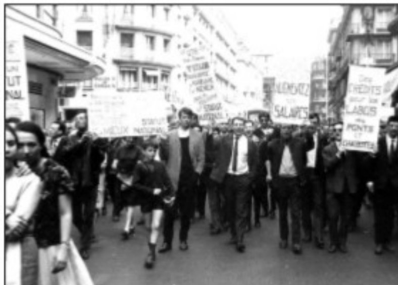
Le 17 mai 1966, dans les rues de Rouen.